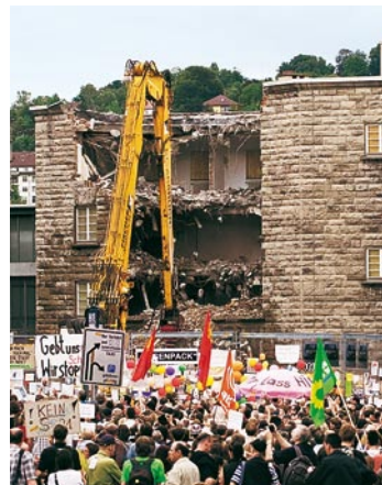
Der denkmalgeschützte Kopfbahnhof wird unter Dauerprotest seit Ende August abgerissen

ten wegfrisst, in Baden-Württemberg wie im Rest der Republik? Wenn man bei den Verantwortlichen in Berlin und Stuttgart, sei es bei der Bahn, dem Verkehrsminister, dem Ministerpräsidenten von Baden-Württemberg, diese Fragen stellt, sagen sie: Das sei so beschlossen, es gebe Verträge, die einzuhalten seien. Basta.